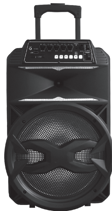
Parlante Activo 12" PK-14BAT

⚠ Please carefully read the operating instruction before using our product